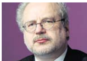
EGILS LEVITS KONSTITUCIONĀLO TIESĪBU SPECIĀLISTS