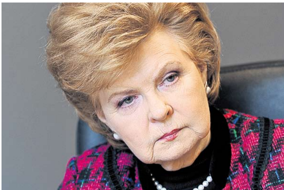
VAIRA VĪĶE-FREIBERGA EKSPREZIDENTE