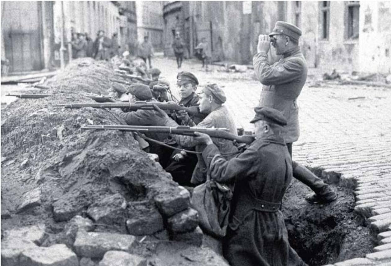
Rīgas Daugavmalas nocietinājumi pret bermontiešiem.

Latviešu sabiedrības emancipācija neatverama loma bija jaunlatviešiem XIX gs. otrajā pusē, viņu galvenais darbības lauks bija latviešu valodas un kultūras kopšana, saglabāšana un veidošana. Pusgadsimta laikā latviešu valoda no zemnieku valodas tika izkopta par pilnvērtīgu literāro valodu. Dziesmu svētki kļuva par tautas pašorganizē-