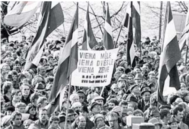
Tautas frontes rīkotā manifestācija Par Latvijas valsti, par brīvu cilvēku. Daugavmala. 1990. gada 17. marts.