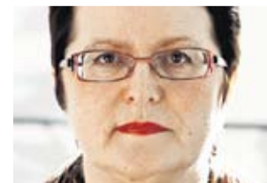
MĀRA ZĀLĪTE DZEJNIECE

Valsts nācijai ir galvenā atbildība valsts veidošanā, un tā nevar svīties un uzvesties kā mazākumtautība. Savukārt personām, kas pieder mazākumtautībām, ir jāvēlas atzīt Latviju raksturojošus pamatelementus un jāvēlas kļūt piederīgiem Latvijai, jo tādējādi viņi stiprina valsti, no kuras viņi gaida savu tiesību aizsardzību. ( Jurista Vārds , 2012, Nr. 1)